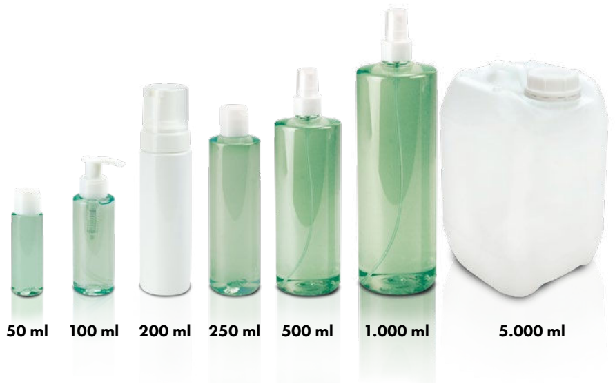
50 ml 100 ml 200 ml 250 ml 500 ml 1.000 ml 5.000 ml

I flaconi dell'olio vengono sigillati con il tappo e lo spray viene inserito separatamente nella scatola di trasporto.