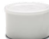
397 g (USA standard)