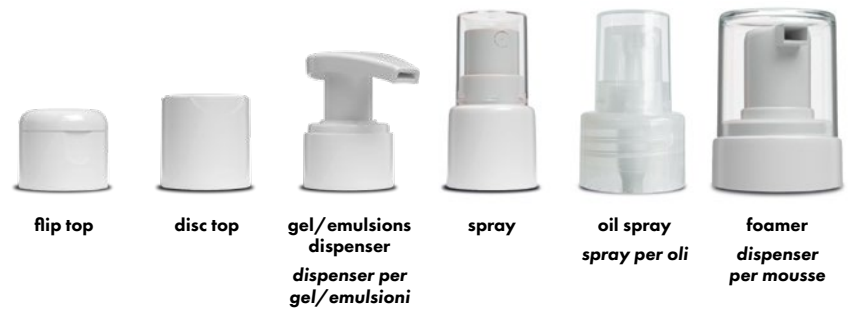
flip top disc top gel/emulsions dispenser dispenser per gel/emulsioni spray oil spray spray per oli foamer dispenser per mousse